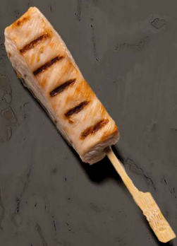
74. KYLLINGEBRYST MED SPICY SAUCE 27 KR / 50 KR