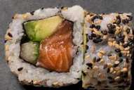
36. LAKS 80 KR