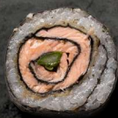
66. DYNAMITE LAKS 85 KR

Tempurastegt laks, asparges og teriyaki sauce.