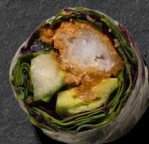
29. DRAGON 90 KR

Softshell krabbe, Avokado, Forårsløg, Masago, Spæde Salat- blade Wasabimayo og Unagi sauce