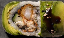
47. VIKING 125 KR

Crispy rejer, avokado, spicy sauce, toppet med tun og tromesco sauce.