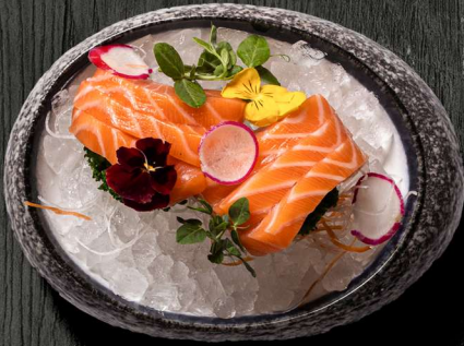
22. SASHIMI LAKS 6 STK. 90 KR