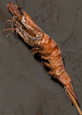
71. REJER MED TERIYAKI SAUCE 27 KR / 50 KR