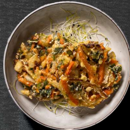
8. TEMPURA KAKIYAKI 2 STK. 40 KR