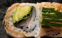
60. SIZZLING YELLOW-TAIL 140 KR

Tun, basilikum, forårsløg, avokado toppet med sizzling tun og yuzu sauce.