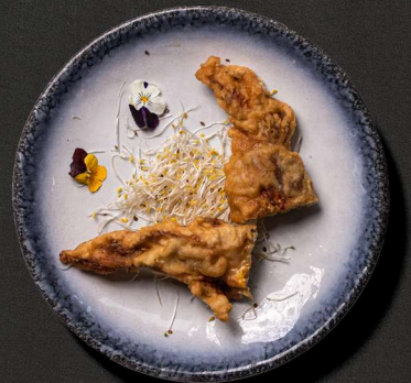
9. TEMPURASTEGTE SOFTSHELL KRAB 85 KR