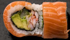
48. SUMMER 130 KR

Crispy rejer, ål, agurk, toppet med avokado sesam og unagi sauce.