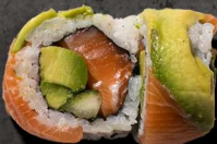
55. PARADISE ROLL 130 KR

Avokado, agurk, tufo ,danmuji koriander top med avokado og spirer.