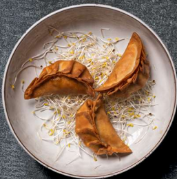
7. TEMPURASTEGTE DUMPLINGS 3 STK. 45 KR