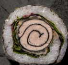
67. DYNAMITE TUN 95 KR

Tempurastegt laks, asparges og teriyaki sauce.