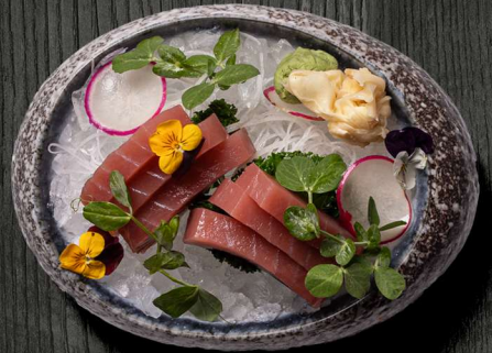
23. SASHIMI TUN 6 STK. 110 KR