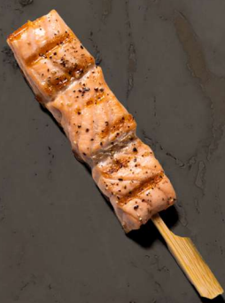
73. LAKS MED TERIYAKI SAUCE 32 KR / 58 KR