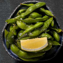
2. EDAMAMEBØNNER MED SALT 30 KR