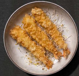
6. TEMPURASTEGT TIGERREJER 3 STK. 45 KR