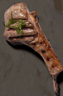
72. LAMMEKØLLE 40 KR / 75 KR