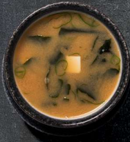
1. MISOSUPPE 30 KR