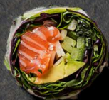
26. LAKS 90 KR

Laks Avokado, Spæde Salatblade Wasabimayo og Unagi sauce