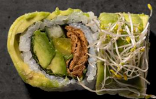
54. HATO VEGETAR 120 KR

Tunatatar, avokado, agurk, kimchee sauce, toppet med tun, laks, yellowtail, rejer, avokado og spicy sauce.