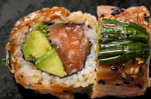
58. SIZZLING LAKS 140 KR

Laks, basilikum, forårsløg, avokado toppet med sizzling laks og yuzu sauce.