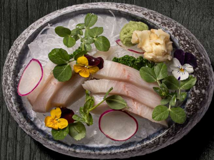
24. SASHIMI YELLOW-TAIL 6 STK. 110 KR