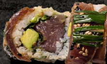
59. SIZZLING TUN 140 KR

Laks, basilikum, forårsløg, avokado toppet med sizzling laks og yuzu sauce.