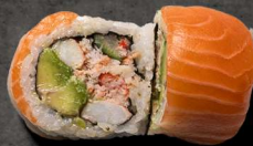
50. RAINBOW 130 KR

Tun, koriander, avokado, agurk, toppet med tuntataki, spicy sauce og kimchee sauce.