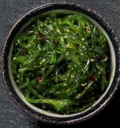
4. HAVTANG SALAT 40 KR