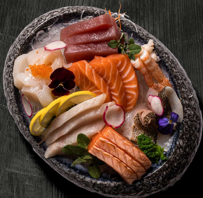
25. SASHIMI MIX 18 STK. 200 KR