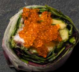
28. SOFTSHELL KRABBE 110 KR

tun, Avokado, Agurk, Spæde Salat- blade Spicy Sauce