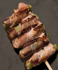
69. ASPARGES MED BACON 32 KR / 58 KR