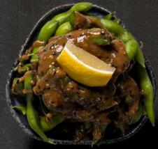
3. SPICY EDAMAMEBØNNER 30 KR