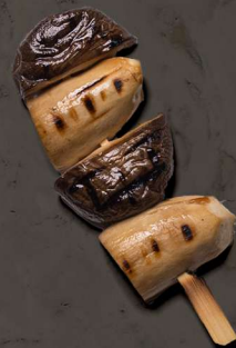
76. KEJSERHAT MED HVIDLØGSOYA SAUCE 27 KR / 50 KR