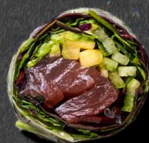
27. TUN 100 KR

Laks Avokado, Spæde Salatblade Wasabimayo og Unagi sauce