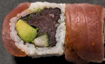
49. DEVILS 135 KR

Rejer, basilikum, avokado, agurk, kimchee sauce, toppet med laks, sesam og kewpie.