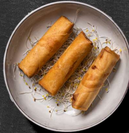
5. STEGT FORÅRSRULLER 3 STK. 45 KR