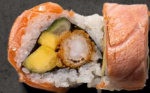
51. SUNRISE 130 KR

Snekrabbekød, avocado, agurk, kewpie, toppet med tun, laks, yellowtail, reje.