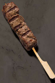
75. OKSEFILET MED SPICY MISO SAUCE 32 KR / 58 KR