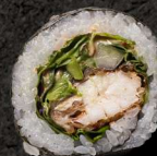
68. DYNAMITE SPIDER 105 KR

Tempurastegt tun, koriander, spæde salablade, toppet med spicy sauce og teriyaki sauce.