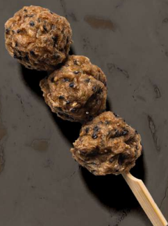
70. KYLLINGE KØDBOLLER MED TERIYAKI SAUCE 30 KR / 55 KR